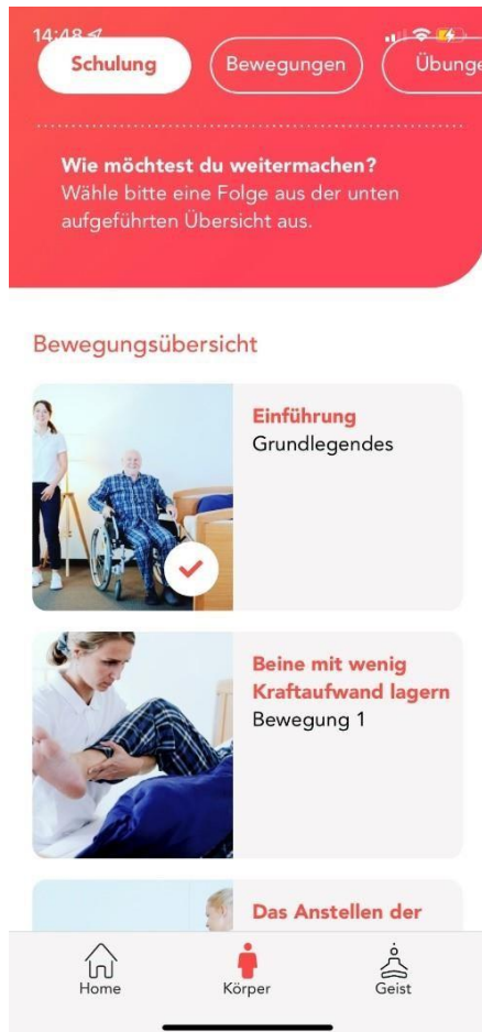
Abbildung 2: Übersicht Bewegungsschulung

In den Bewegungseinheiten erlernen Sie die belastungsarme Bewegungsausführung für typische Bewegungsabläufe aus Ihrem Arbeitsalltag. Die Bewegungen werden dabei in mehrere Arbeitsschritte aufgeteilt, um das Erlernen der komplexen Bewegungen zu vereinfachen.