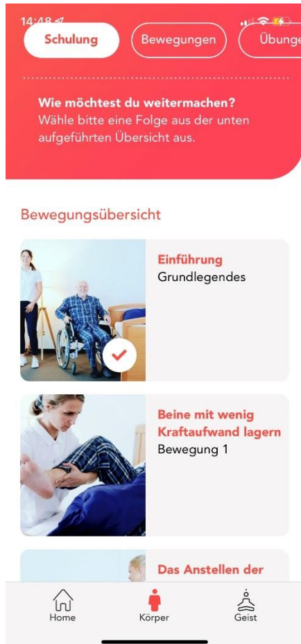
Abbildung 2: Übersicht Bewegungsschulung

In den Bewegungseinheiten erlernen Sie die belastungsarme Bewegungsausführung für typische Bewegungsabläufe aus Ihrem Arbeitsalltag. Die Bewegungen werden dabei in mehrere Arbeitsschritte aufgeteilt, um das Erlernen der komplexen Bewegungen zu vereinfachen.